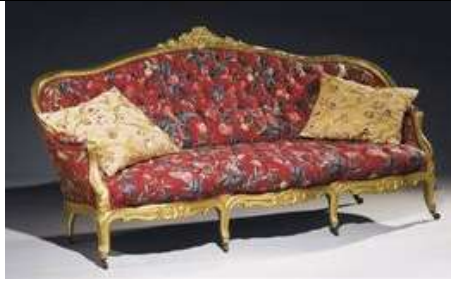
Canapé d'époque Napoléon III, seconde moitié du XIXème, en bois sculpté et doré, garniture capitonnée, Christie's Images Ltd. 2009.