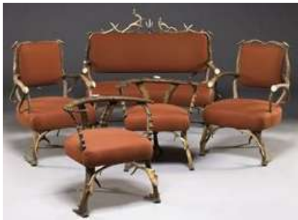
Mobilier de salon XXème siècle en bois de cervidé, Christie's Images Ltd. 2009.

E n parallèle aux œuvres du XIXème siècle, celles du XXème siècle se sont également bien défendues. Mentionnons par exemple, un ensemble de mobilier de salon, en bois de cervidé, du XXe siècle, qui est parti à 169.000 euros (alors qu'on en attendait entre 6.000 et 8.000 euros) et un lustre en bois de cerf et d'élan, vendu pour 91.000 euros (alors qu'il était également estimé entre 6000 et 8000 euros).