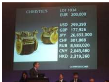
Théâtre Marigny, vente Christie's, 20 novembre 2009

Cette seconde dispersion organisée au profit de la recherche sur le VIH et la lutte contre le sida proposait près de 1 200 objets intimes provenant du château Gabriel, des demeures parisiennes des deux mécènes et du bureau d'Yves Saint Laurent (de sa maison de couture, avenue Marceau).