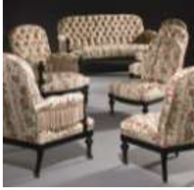
Mobilier de salon d'époque Napoléon III, seconde moitié du XIXème siècle, Christie's Images Ltd. 2009.