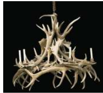
Lustre XXème siècle en bois de cerf et d'élan, à cinq lumières. Haut. 12 cm

Un guéridon de Marc du Plantier en métal doré à l'imitation d'une gerbe de blé stylisée a été adjugé 97.000 euros pour une estimation de 3/5.000 euros.