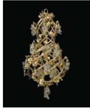
Lustre, travail 1900, en bronze ciselé et doré et pampilles en cristal et verre en partie teinté, à motif de raisin, à dix-neuf lumières, haut. 124 cm.

A l'inverse, plusieurs lots ont été vendus en deçà des estimations : un grand bassin de type fahua chinois, d'époque Ming, du début XVI e , à décor émaillé polychrome de fleurs de lotus espéré à 40 000/60 000 euros, a été adjugé 37.000 avec les frais. Une suite de six appliques de style Louis XV en cristal de roche et bronze doré de la maison Baguès accrochées sur les murs de la chambre d'Yves Saint Laurent, rue de Babylone n'est parties qu'à 22.500 euros frais inclus alors qu'elle était estimée entre 40.000 et 60.000 euros.