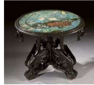
Guéridon d'époque Napoléon III, seconde moitié du XIXème, en bois sculpté et noirci, haut. 75 cm