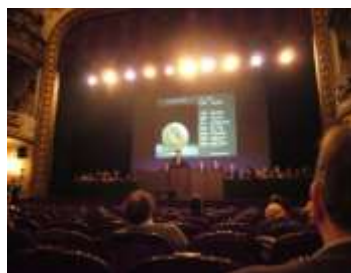
Théâtre Marigny, vente Christie's, 20 novembre 2009

Les ventes Pierre Bergé-Yves Saint Laurent auront donc marqué le marché de l'art 2009. Après la première session record de cette collection, qualifiée de "vente du siècle" en février dernier au Grand Palais, et qui avait totalisé plus de 373 millions d'euros, une deuxième vacation était orchestrée par Christie's du 17 au 20 novembre dernier au Théâtre Marigny à Paris.