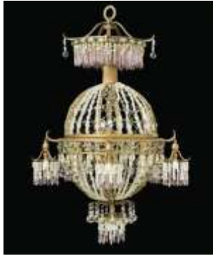
Lustre du début du XX ème siècle en bronze et métal dorés, à décor de cristal et verre teinté, haut. 132 cm, Christie's Images Ltd. 2009.