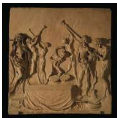
Bas relief représentant une danse macabre en terre cuite, XVIIème siècle, 41,5 x 45 cm.

Dans le domaine de la sculpture ancienne, et occupant la deuxième place de l'enchère la plus élevée de la vacation, un bas relief italien en terre cuite du milieu du XVIIème siècle représentant une danse macabre a atteint 193.000 euros frais inclus alors qu'il était estimé 10 à 15.000 euros. Pour la sculpture moderne, c'est L'homme de Draguignan de César qui a vu son prix s'élever à 157.000 euros pour une estimation de 40 à 60.000 euros.