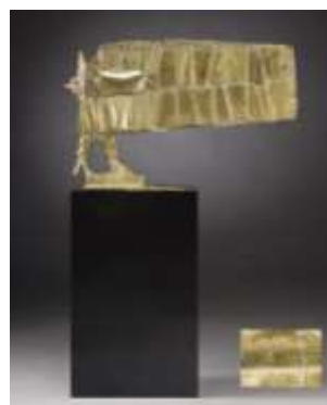
César (César Baldaccini dit, 1921-1998) L'homme de Draguignan, bronze à patine dorée 65,5 x 101 x 22,5 cm

Toutes époques confondues, les luminaires ont également fait de beaux prix :