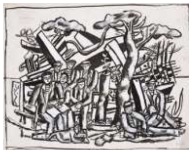
Fernand Léger (1881-1955) Les travailleurs au repos, gouache et encre noire, 49 x 62 cm

Contrairement à la première vacation, seule une soixantaine d'œuvres graphiques était présentée. La palme a été remportée par une gouache de Fernand Léger. Estimée 50.000 euros, elle a été vendue 150.000 euros.