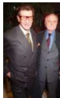
Yves Saint-Laurent et Pierre Bergé

Contrairement à la première édition de février 2009 qui réunissait des œuvres prestigieuses de haut niveau, tel un Picasso ou un fauteuil d'Eileen Gray, ce deuxième volet présentait toute une suite d'objets et de meubles qui entouraient le couple au quotidien, reflétant leur goût raffiné et éclectique.