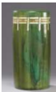
Porte parapluies, en céramique émaillée vert, haut. 54 cm, Christie's Images Ltd. 2009.

Les prix ont aussi flambés pour des objets ordinaires comme un porte-parapluie qui était placé dans l'entrée de l'appartement du couturier, rue de Babylone, qui a été adjugé 109.000 euros (avec frais) alors qu'il était estimé entre 300 et 500 euros.