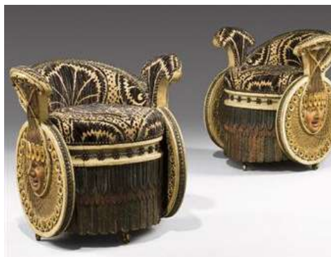
Paire de fauteuils de bal en bois, d'époque Empire

L'enchère la plus haute de la vente a été obtenue par la paire de fauteuils bas circulaires réalisés pour le bal indien donné par la reine Hortense, installés dans le grand salon. Estimés à 7 000/9 000 euros, ils ont été adjugés 241.000 euros frais inclus.