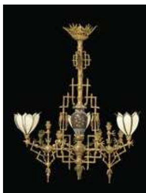
Deux lustres formant paire, d'époque Napoléon III, peut être par Ferdinand Barbedienne, en bronze ciselé et doré à motif de bambou, haut. 107 cm, Christie's Images Ltd. 2009.

Toutes époques confondues, les luminaires ont également fait de beaux prix :