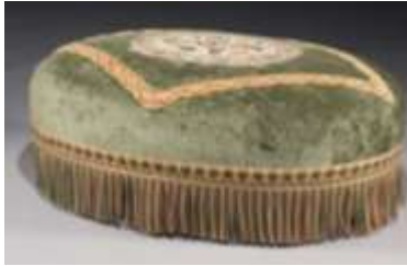
Pouf de style Napoléon III, XXème, haut. 46 cm, Christie's Images Ltd. 2009.

Un pouf de style Napoléon III, mais du XXème siècle, de forme ovale en velours vert et base à franges polychromes est parti à 79.000 euros (estimé à 1.500/2.000 euros).