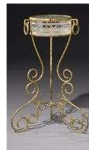
Table à ouvrage d'époque Napoléon III, bronze ciselé et doré, haut. 77 cm, Christie's Images Ltd. 2009.

Notons également le franc succès du mobilier Napoléon III : une délicate table à ouvrage d'époque Napoléon III, de la Maison Alphonse Giroux, en bronze ciselé et doré à motif de bambou, le coffret en cristal gravé à décor végétal, estimée entre 2.000 et 3.000 euros, s'est envolée à 49.000 euros avec les frais. Un mobilier de salon Napoléon III a été vendu 49.000 euros avec frais alors qu'il était estimé entre 4.000 et 6.000 euros. Un canapé en bois sculpté et doré, estimé 2 à 3.000 euros a atteint 35.800 euros frais compris. Un guéridon Napoléon III en bois sculpté noirci à plateau en bronze et émaux cloisonnés chinois XVIIIe à décor de rochers, pivoines et oiseaux a atteint 34.600 euros (estimé 20 à 30.000 euros).